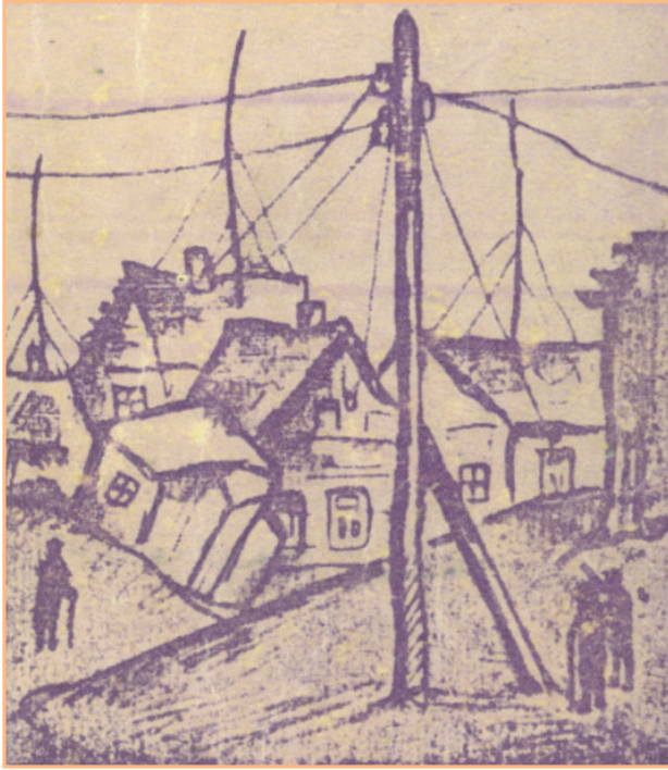
From the back cover of The Zelmanyaners , Central People's Press of the FSSR, Moscow, 1931.

The Zelmanyaners were sparing of words. Regarding the circle around them with a superior look to betoken that (trust them) they knew everything and weren't talking, they vanished back among the scaffolds to resume their secret work – most likely, pulling nails from the walls.